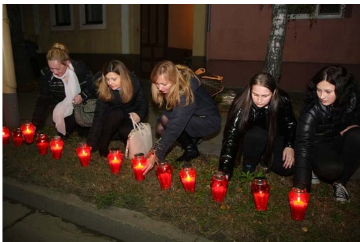
Slika 2. Obilježavanje Dana sjećanja na žrtvu Vukovara 6