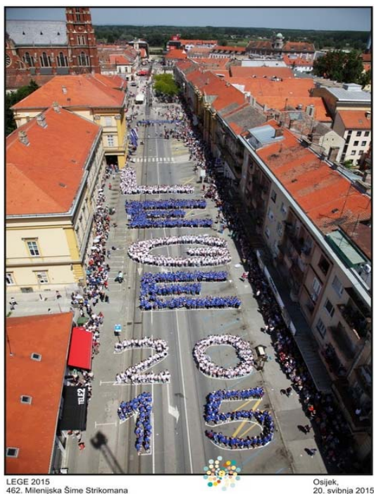
Slika 1. Milenijska fotografija 5

Projekt je u 2015. godini bio izrazito zahtjevan u organizacijskom pogledu, obuhvaćao je od učenja plesa Quadrille u samim školama, organiziranje generalnih proba u svakom od navedenih gradova i koordinaciju događaja do osiguranja financijskih sredstava.