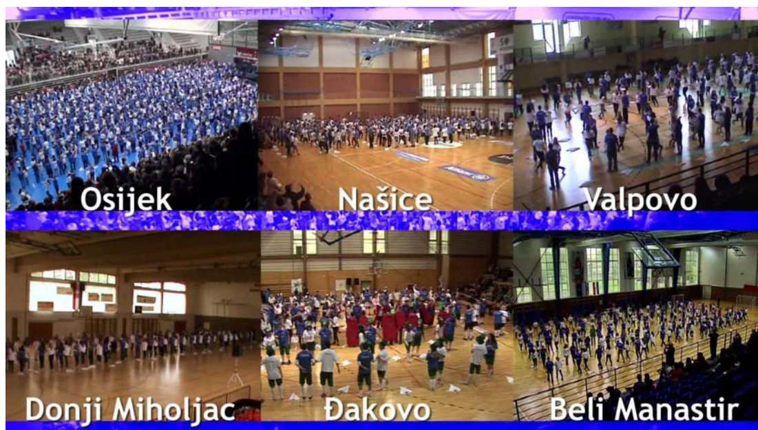
Slika 1. Plesanje Quadrille u gradovima Osječko-baranjske županije 5

Program ispraćaja maturanata posljednjeg dana nastave započeo je doručkom u njihovim školama i školskim programom ispraćaja, uslijedilo je okupljanje maturanata u dvoranama, nakon čega je točno u 12:00 sati uslijedilo plesanje Quadrille. Osječki maturanti su nakon plesa u Nastavno-sportskoj dvorani "Gradski vrt", u istom prostoru imali organizirani program koji je, u kasnim večernjim satima, završio koncertom grupe Leteći odred.