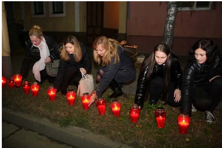
Slika 2. Obilježavanje Dana sjećanja na žrtvu Vukovara 6

U 2014. godini za realizaciju Programa sufinanciranja projekta obilježavanja Dana sjećanja na žrtvu Vukovara u osnovnim i srednjim školama u Proračunu Županije utrošeno je 29.612,50 kuna. Svijeće su se palile 17. studenoga 2014. godine duž Vukovarske ulice, prema rasporedu koji je dogovoren sa školama. Županija je osigurala sredstva za 4.600 lampiona koje su upalili učenici srednjih škola, a Grad Osijek je osigurao sredstva za isti broj lampiona koje su upalili učenici osnovnih škola s područja grada Osijeka. Ovim programom dostojanstveno smo se sjetili svih palih branitelja i civilnih žrtava, ali i Grada čija je žrtva u stvaranju slobodne i neovisne Hrvatske postala nacionalni simbol jedinstva i ponosa hrvatskog naroda.