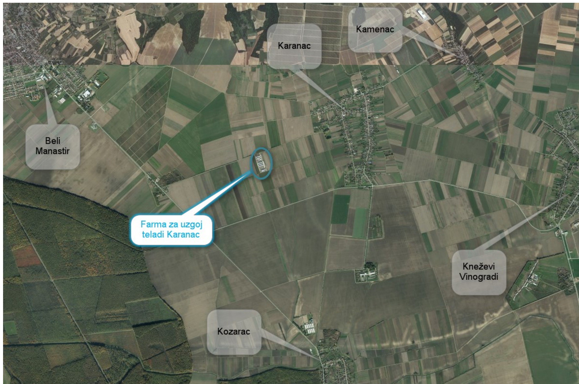
Prilog 1. Širi prikaz lokacije zahvata na orto-foto karti M 1:40 000