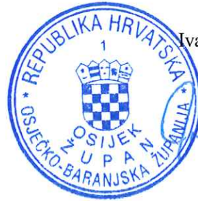
Župan Ivan Anušić

Ova Odluka stupa na snagu 23. studenoga 2020. godine, a bit će objavljena na internetskim stranicama Osječko-baranjske županije.